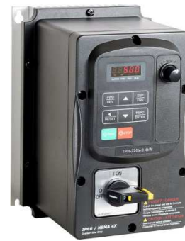
Frequenzumrichter FUS 037 ... 220/E5/IP66 FUS 075 ... 1850/3E5/IP66 CE cUL US LISTED